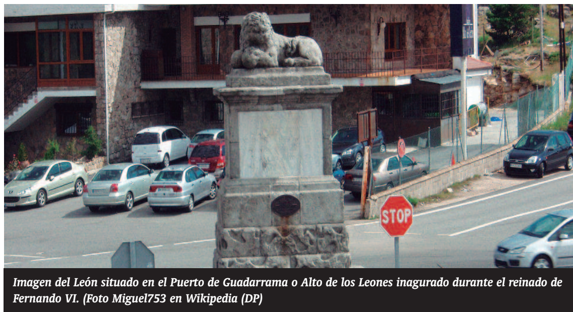
Imagen del León situado en el Puerto de Guadarrama o Alto de los Leones inaugurado durante el reinado de Fernando VI.

como él, y de los leones de piedra de alto Guadarrama, testigo de una guerra civil cruel, inútil y absurda; testigo de los juegos de infancia en la fría mañana, en la fría nevada, testigo de las vacaciones en El Espinar, cuando aquellas residencias albergaban a los obreros que no tenían dinero, y a tus amigos y a mí, cuando la luz del sol iluminaba nuestras vidas y gozábamos de aquella alegría inconsciente de los que ignoran lo que les espera, y olvidan tantas cosas por venir, tantos tiempos amargos; porque tú, león rugiente del Alto de los Leones, del alto Guadarrama, desde el telediario matutino y todos los telediarios que tengan que venir, me recuerdas, me recordarás siempre quien soy, y siempre lo seguirás haciendo.