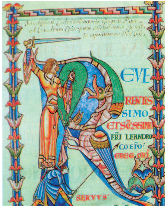
Iluminación en un manuscrito de una carta del siglo XIII de Gregorio I a San Leandro (Bibl. Municipale, MS 2, Dijon).

En el libro de Daniel, en concreto en el capítulo 14 –una de las adiciones griegas al texto hebreo–, también hallamos un episodio –de tono burlesco y popular– con un dragón: