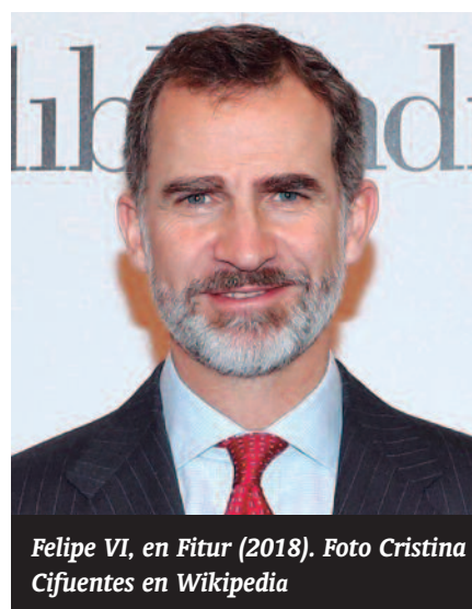
Felipe VI, en Futur (2018).

TENEMOS UN REY PLENO DE SENTIDO COMÚN Y QUE TRABAJA PARA EL BIEN COMÚN. UN REY “COMUNERO”, no de Castilla, COMUNERO DE ESPAÑA, DE LAS COMUNIDADES DE LA ESPAÑA COMUNERA. (Homenaje a Manuel LIZCANO para quién le recuerde)