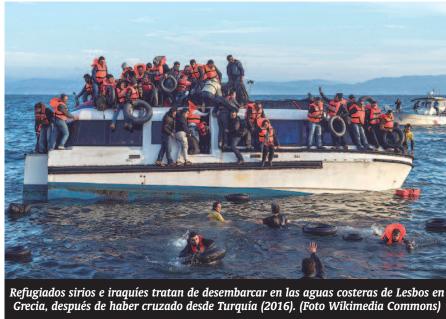
Refugiados sirios e iraquíes tratan de desembarcar en las aguas costeras de Lesbos en Grecia, después de haber cruzado desde Turquía (2016).

D erribar esos “muros del miedo” que tanto atenazan a muchos, incluso dentro de la Iglesia, y que FRANCISCO está dispuesto a que esos muchos sepan que los muros dividen y no ayudan a que las puertas del egoísmo, si acaso tienen alguna, se abran. El Papa sigue la estela de sus predecesores y la de Chipre es la segunda visita que realiza un Pontífice a la isla dividida tras el conflicto greco-turco, después de la realizada por Benedicto XVI en 2010. Y decimos que FRANCISCO sigue con su idea de es-