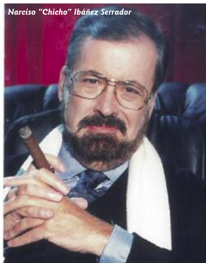
Narciso "Chicho" Ibáñez Serrador