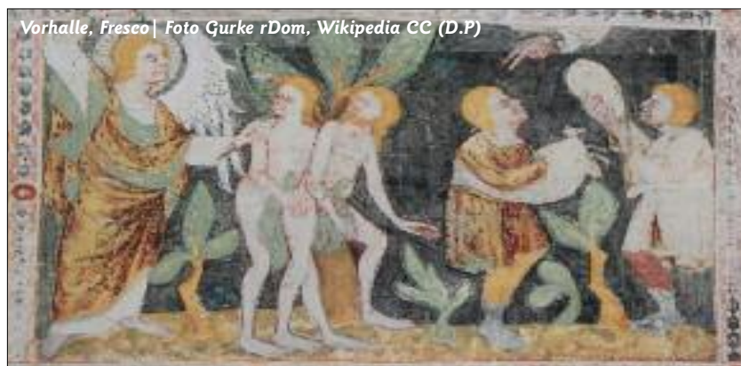
Vorhalle, Fresco

Un famoso pensador judío prácticamente contemporáneo de Jesús también tiene algunos pasajes donde la mujer no es contemplada con muy buenos ojos, ya que se la relaciona con el deseo y el placer, considerados negativamente. El principal rasgo de Filón de Alejandría (15 a. C.