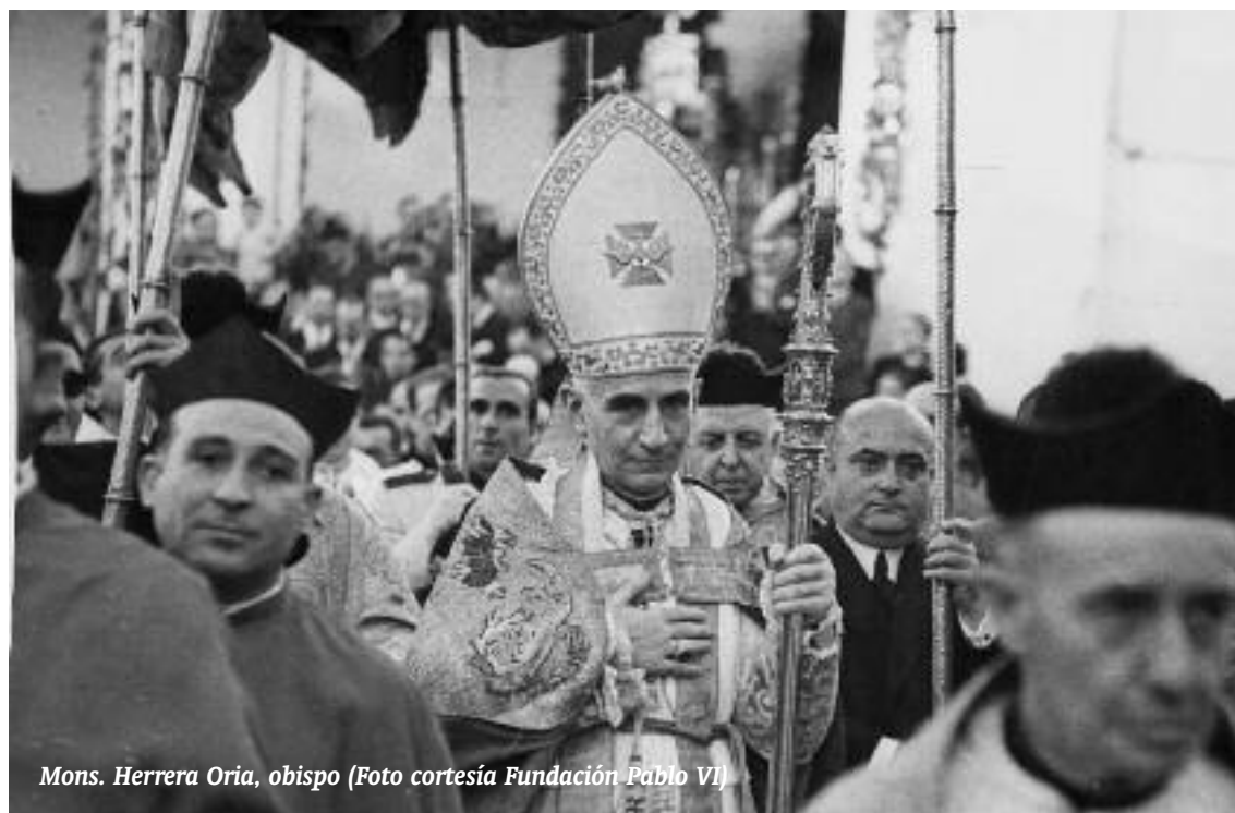
Mons. Herrera Oria, obispo

Nosotros mismos, hemos publicado una se-