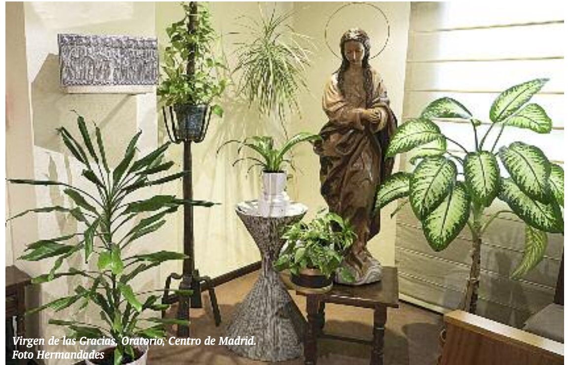
Virgen de las Gracias, Oratorio, Centro de Madrid.

Esta es la primera lección, lección de oscuridad: huir de la exhibición de la luz de la vanidad. María, la Inmaculada por privilegio singularísimo; José, el hombre justo por excelencia;