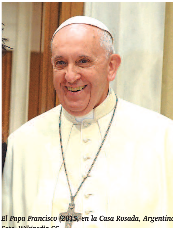
El Papa Francisco (2015, en la Casa Rosada, Argentina)